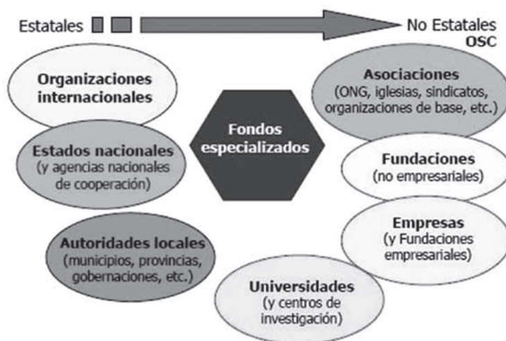
Figura 1.4. Actores de la Cooperación al desarrollo

Esto ha generado dinámicas de transnacionalización y de interdependencia cada vez más intensas, mientras que la globalización de las finanzas ha incrementado la influencia de los actores privados en la financiación del desarrollo. Como se señaló anteriormente (ver punto 1.5.2), esta situación ha contribuido a la multiplicación de los “fondos globales” y de otros mecanismos innovadores en los cuales las empresas y los otros actores no estatales juegan un papel importante. Por consiguiente, en la actualidad el panorama de los actores es sumamente articulado (ver Figura 1.4).