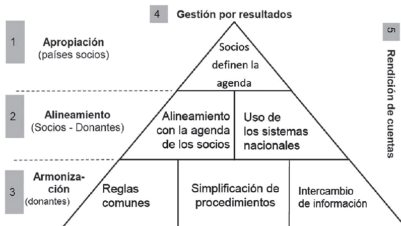
Figura 1.3. Pirámide de la eficacia de la ayuda

En 2005, se creó el “Grupo de trabajo sobre la eficacia de la ayuda”, o Working Party on Aid Effectiveness (WP-EFF), con el fin de reunir a los donantes, las organizaciones multilaterales y los gobiernos receptores para valorar el avance en la aplicación de la Declaración de París y establecer las prioridades de los siguientes foros de alto nivel 70 . La Agenda de Acción de Accra (AAA), adoptada el 4 de septiembre de 2008 en el marco del III Foro de Alto nivel sobre la Eficacia de la ayuda, reafirma los contenidos de la Declaración de París, reconoce las dificultades encontradas e identifica una agenda operativa para aumentar el compromiso de la comunidad internacional con la eficacia de la ayuda al desarrollo.